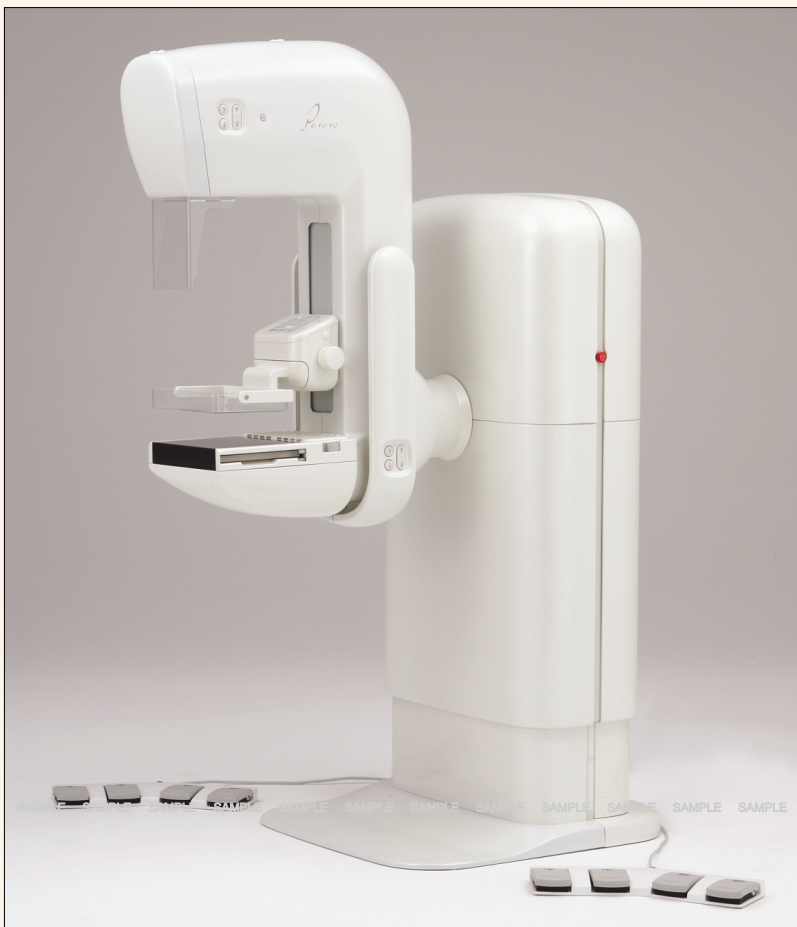
■ 東芝乳房X線撮影装置